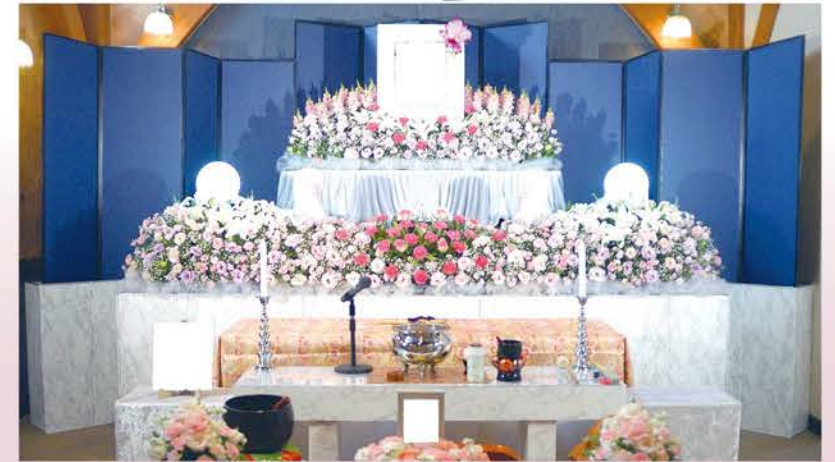
◎お花の色合い・デザインは変更可能です。◎御遺影は四切サイズです。◎祭壇の幅は約2.2mです。