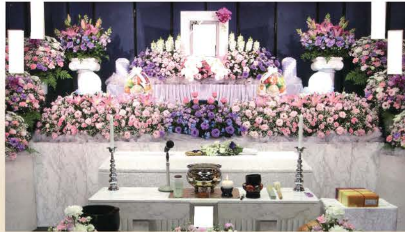
◎お花の色合い・デザインは変更可能です。◎御遺影は四切サイズです。◎祭壇の幅は約3mです。