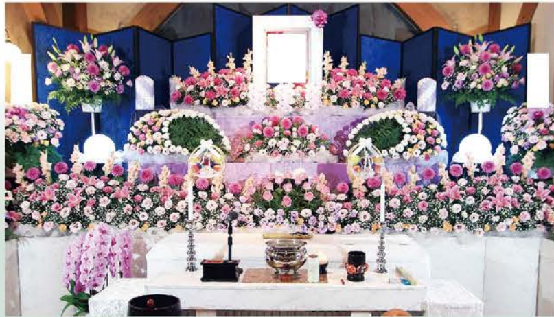
◎お花の色合い・デザインは変更可能です。◎御遺影は半切サイズです。◎祭壇の幅は約5mです。